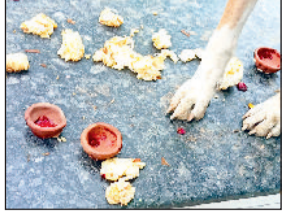
सोनीपत। तांत्रिक विधि के बाद दीये एवं अन्य सामग्री।