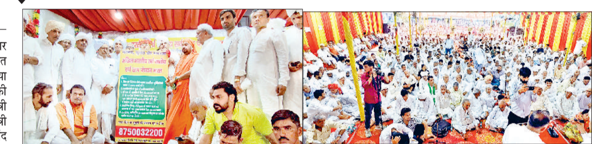
गन्जौर। सर्वजातीय सर्वखाप पंचायत महासम्मेलन में संबधित मुद्दों को आगे बढ़ाने के लिए मोबाईल नम्बर जारी करते व महासम्मेलन में उमड़ा जनसमूह।