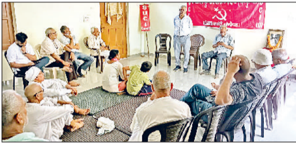
सोनीपत। सभा के दौरान एसयूसीआई के पदाधिकारी एवं सदस्यगण।