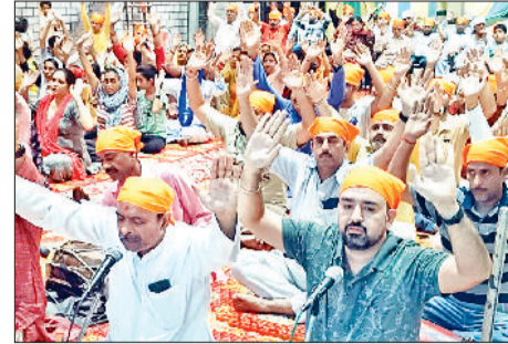
सोनीपत। रविवा को कार्यक्रम के दौरान उपस्थित श्रद्धालुगण साथ में आयोजन समिति के पदाधिकारी।

दशहरे के पवन अवसर पर श्री राम परिवार द्वारा श्री पवनपुत्र सेवा समिति, सोनीपत के माध्यम से श्री सनातन धर्म सभा दुर्गा मंदिर, सोनीपत में भव्य धार्मिक कार्यक्रम का आयोजन किया गया। इस अवसर पर श्री सुन्दरकाण्ड का पाठ, हरिनाम संकीर्तन एवं श्री रामकथा का आयोजन किया गया। कार्यक्रम का आयोजन विशेष रूप से दशहरे पर हनुमान का स्वरूप धारण करने के लिए अपने