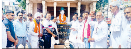
गोहाना। बलिदानी भगत सिंह की प्रतिमा पर पुष्प अर्पित करके नमन करते हुए नागरिक।