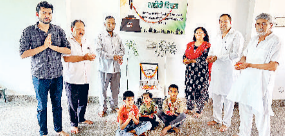
सोनीपत। कार्यक्रम के दौरान शहीद भगत सिंह को नमन करते हुए।